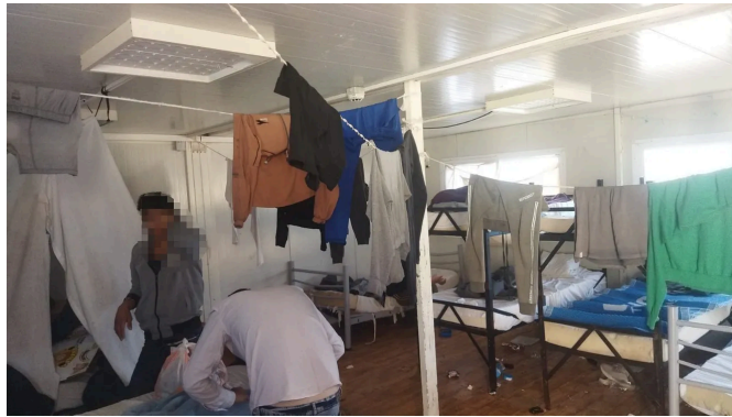
... und überfüllte Schlafräume: die «Safe Area» auf Samos.

Zudem decken sich ihre Schilderungen in den meisten Punkten mit den Schilderungen von vier weiteren Jugendlichen, die wochenlang in der Safe Area von Samos eingeschlossen waren. Auch sie erzählen von Überbelegung, von Krankheiten und mangelnder medizinischer Versorgung, von gewalttätigen Übergriffen und von Vormunden, die es meist nur auf dem Papier gibt – und davon, dass die Safe Area in Wirklichkeit ein Gefängnis ist.