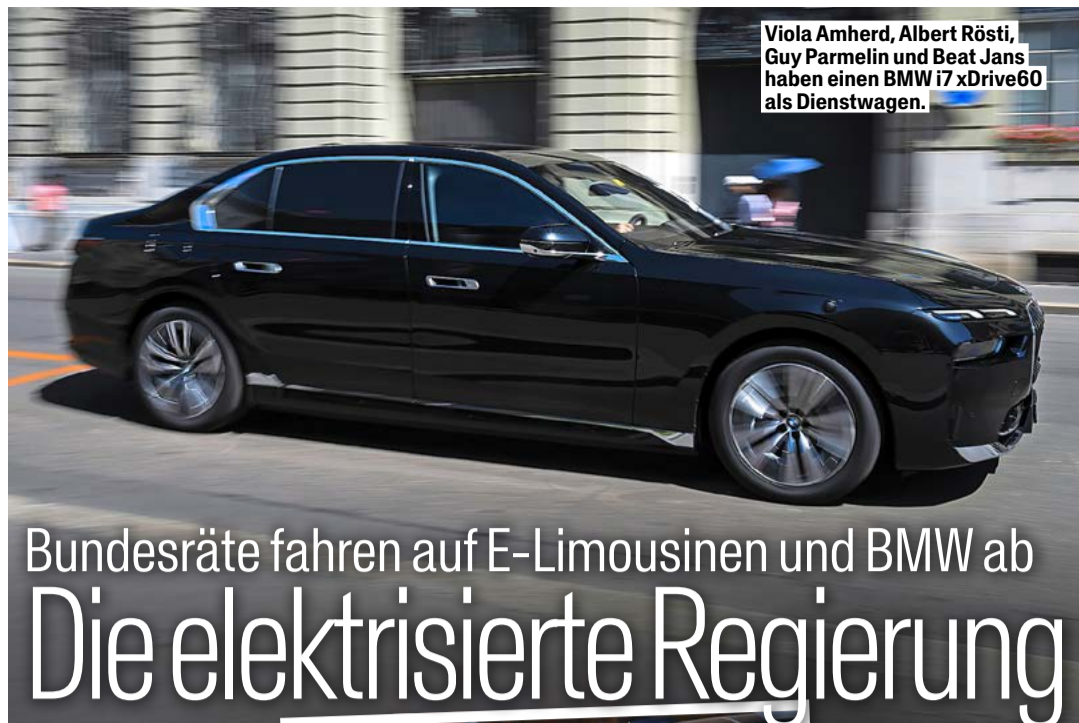
Viola Amherd, Albert Rösti, Guy Parmelin und Beat Jans haben einen BMW i7 xDrive60 als Dienstwagen.

Das Begehren will Bund, Kantone und Gemeinden verpflichten, die vom Menschen verursachte Klimaerwärmung