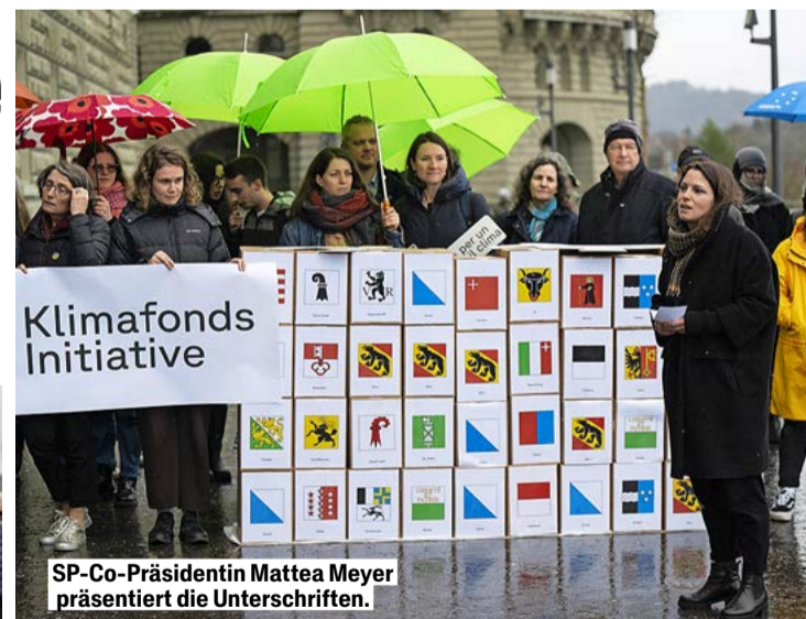
SP-Co-Präsidentin Mattea Meyer präsentiert die Unterschriften.

und zwar jährlich und bis 2050 mit 0,5 bis 1 Prozent des Bruttoinlandsprodukts (BIP). Dies entspricht einem Betrag zwischen 3,5 und 7 Milliarden Franken. Der Beitrag des Bundes an den Fonds kann laut Initiativtext «angemessen gesenkt» werden, wenn die Schweiz die nationalen und internationalen Klimaziele erreicht hat.