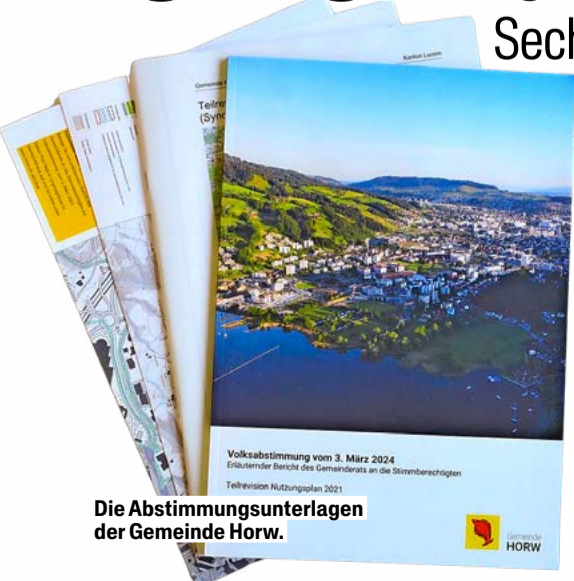
Die Abstimmungsunterlagen der Gemeinde Horw.

Sechs Tonnen Altpapier wegen kommunalem Urnengang