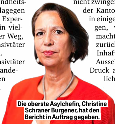
Die oberste Asylchefin, Christine Schraner Burgener, hat den Bericht in Auftrag gegeben.

Der Bund kann die Kantone nicht zwingen, ein Vergleich der Kantone dürfte aber in einigen Monaten zeigen, wer vorwärtsmacht und wer eher zurückhaltend ist bei Inhaftierungen und Ausschaffungen. Der Druck aus der Öffentlichkeit dürfte in den weniger forschenden Kantonen dann gross werden.