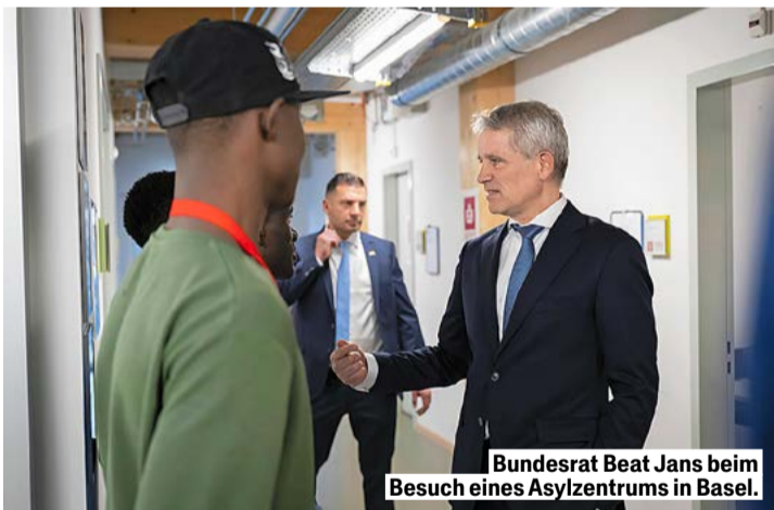
Bundesrat Beat Jans beim Besuch eines Asylzentrums in Basel.

gesetzliche Grundlage dafür gibt. In seinem Departement ist man allerdings überzeugt, das in Eigenregie mit einer Anpassung der Verordnung einführen zu können. Das dauert mindes-