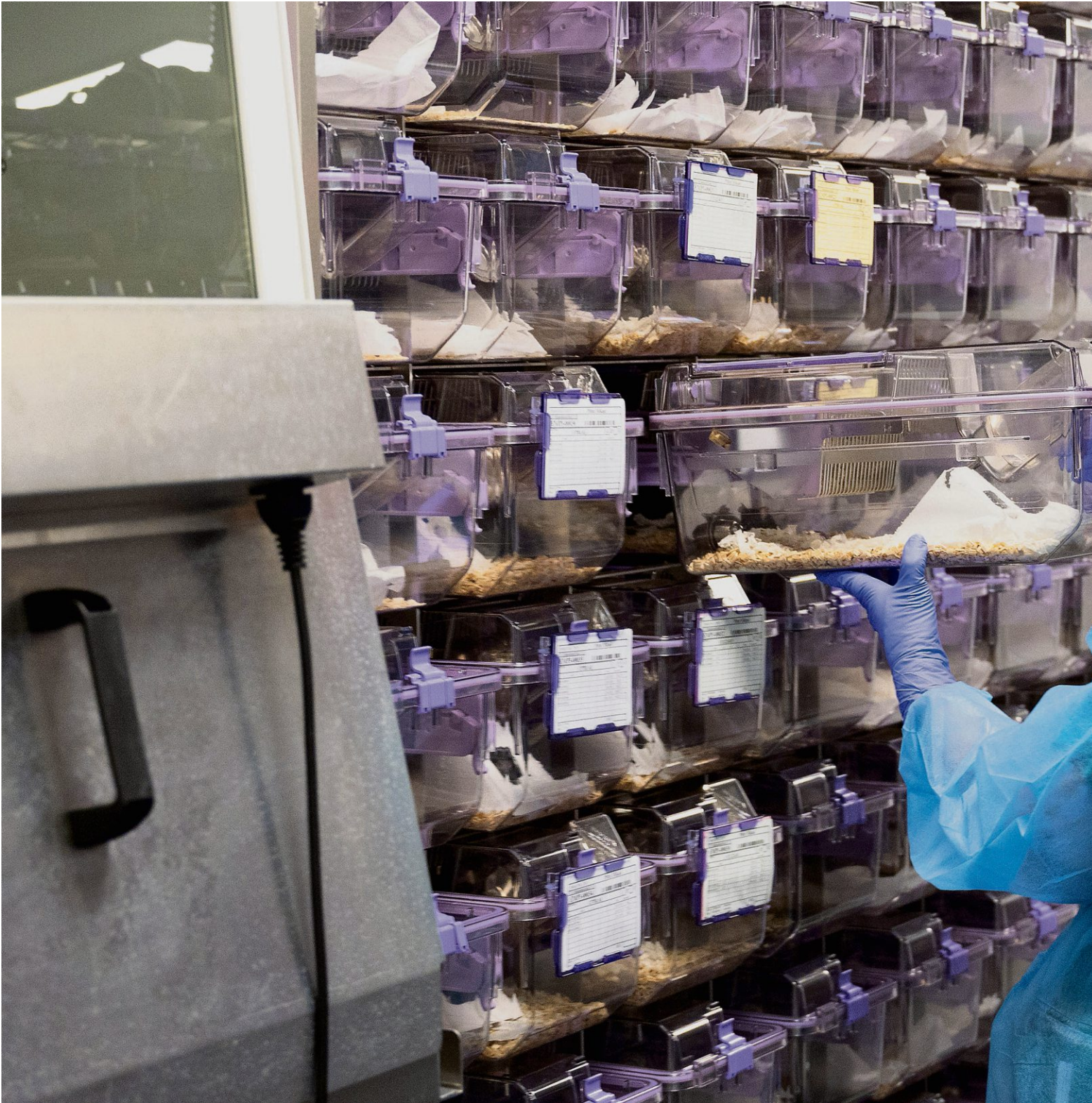
Die Käfige für Labornager sind steril und standardisiert, so wie hier in einer Tierversuchshaltung in der Westschweiz.

Humanere Tötungsmethoden gibt es schon heute, zum Beispiel