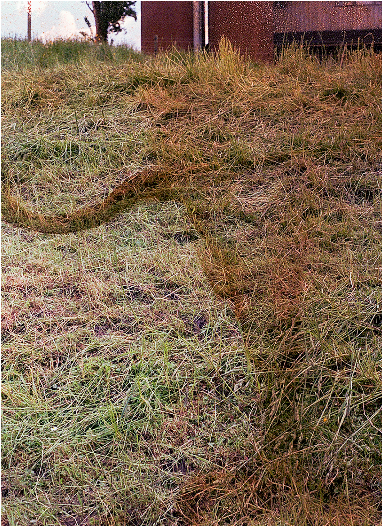
Fotografie aus der Landwirtschaft, entwickelt mit Dünger und Pflanzenschutzmitteln.