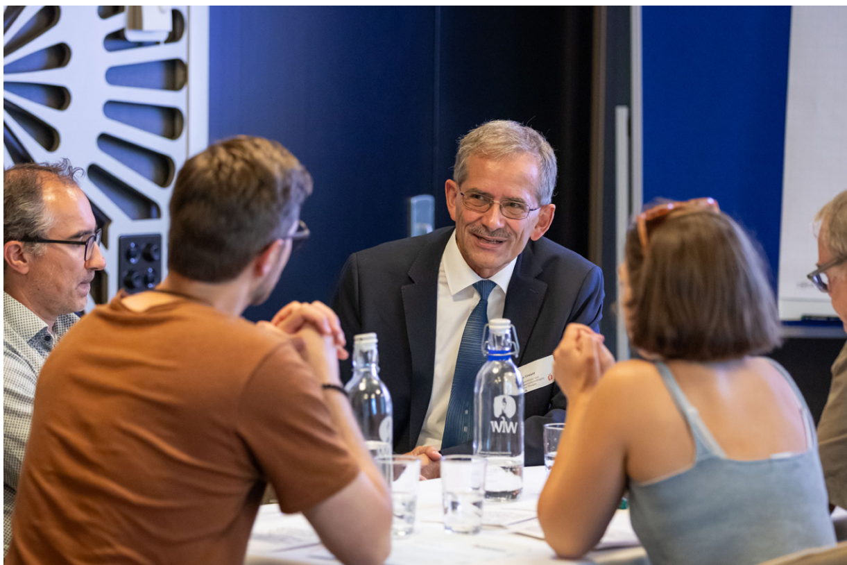
Transparenz-Zmittag in Winterthur.

Ähnlich verlief das Verfahren um Dokumente der Zürcher Gesundheitsdirektion. Sieben Jahre lang kämpften wir für mehr Transparenz bei interkantonalen Konferenzen. Obwohl Gerichte die Herausgabe bestätigten, zog die Gesundheitsdirektion den Fall bis vor Bundesgericht. Für externe Rechtsberatung durch eine Rechtsprofessorin mit einem Stundensatz von 430 Franken wurden dabei 28'476.35 Franken Steuergelder eingesetzt. Auch bei der Finanzmarktaufsicht Finma bleibt Transparenz umstritten. Die Behörde ist bis heute nicht dem Öffentlichkeitsgesetz unterstellt. Eine parlamentarische Initiative von SVP-Nationalrat Rémy Wyssmann wollte dies ändern. Wir unterstützten den Vorstoss 2025 aktiv. Im März 2026 lehnte der Nationalrat den Antrag jedoch ab. Damit bleibt die Finma weiterhin von den Transparenzregeln der Bundesverwaltung ausgenommen.