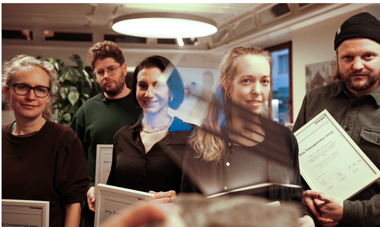
Prix Transparenz 2025 ging an «Republik» und WAV.

Für unsere öffentlich zugängliche Datenbank erstellte unser juristischer