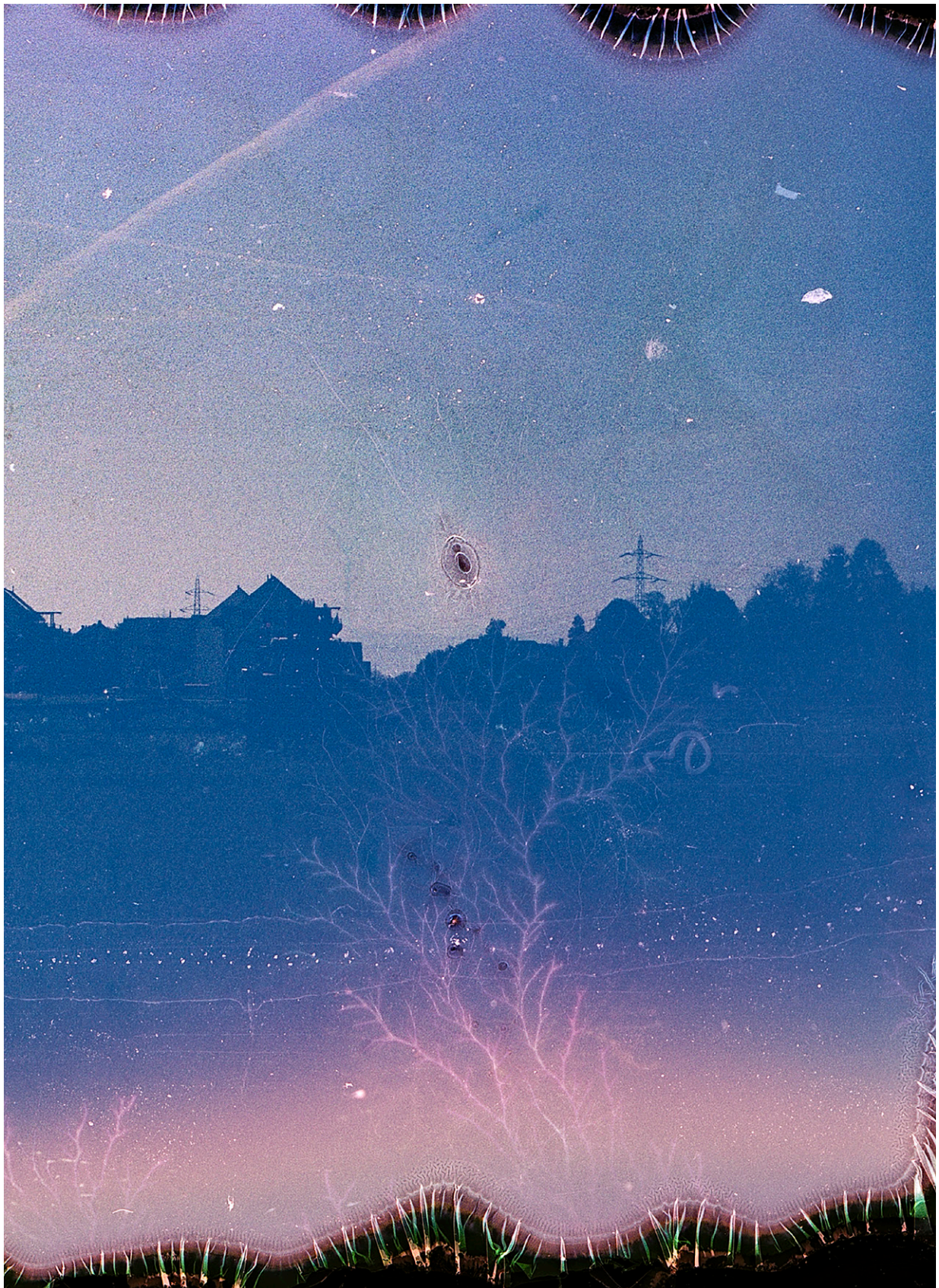
Fotografie aus der Landwirtschaft, entwickelt mit Dünger und Pflanzenschutzmitteln.