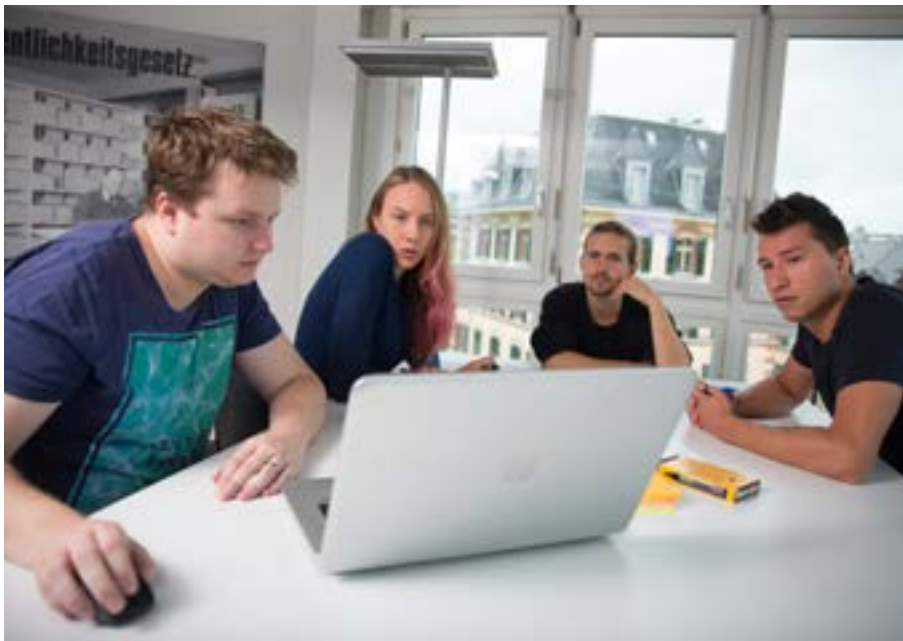
Erfahrungen teilen: Medienschaffende im Kurslokal in Bern.