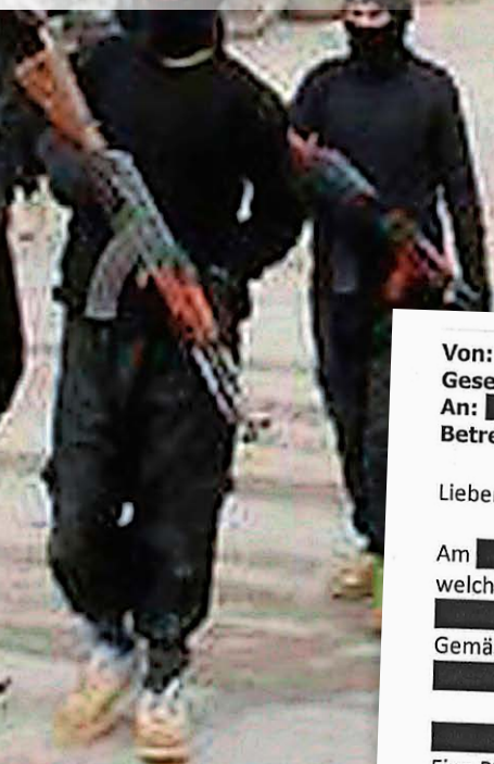
Kämpfer der Terrormiliz Islamischer Staat im nordsyrischen Rakka.

Von: [REDACTED] FSTA Gesendet: [REDACTED] 2016 09:22 An: [REDACTED] FSTA Betreff: Meldung [REDACTED]